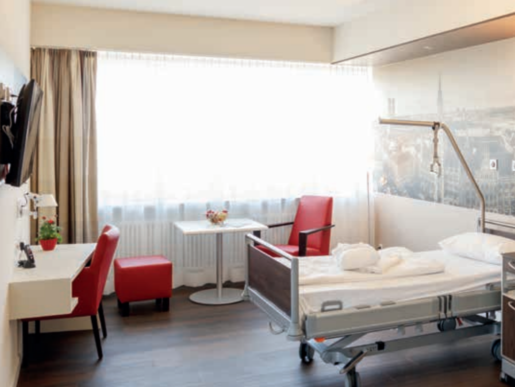
Warme Erd- und Holztöne sowie ein spezielles Beleuchtungskonzept sorgen für ein Wohlfühl-Ambiente