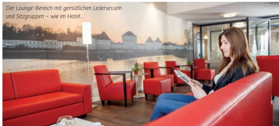
Der Lounge-Bereich mit gemütlichen Ledersesseln und Sitzgruppen – wie im Hotel...