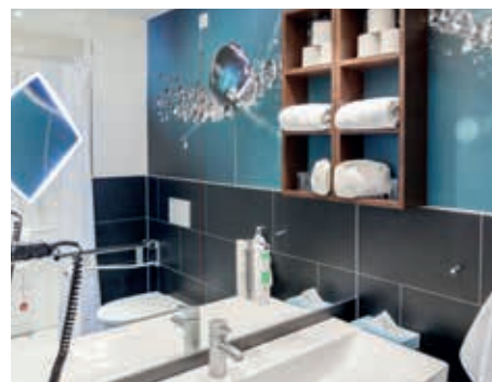
Hochwertig ausgestattete Bäder mit viel Ablageflächen und u.a. Kosmetikspiegel, Fön sowie beheiztem Handtuchhalter